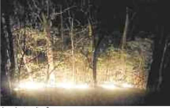
चैतमा के जंगल में लगी आग।

उल्लेखनीय है कि गर्मी का सीजन शुरू होते ही जंगल में आगजनी का सिलसिला शुरू हो जाता है। अप्रैल के महीने में तापमान 43 डिग्री के पास जा पहुंचा है। ऐसे में जंगल धू-धूकर चल रहा है। कोरबा और कटघोरा वनमंडल के कई इलाकों में लगातार आगजनी की घटना सामने आ रही है। नया मामला बालको रेंज के दूधियाटंगर व लेमरू मार्ग में सामने आई है। इस इलाके में कई जगह जंगलों में आग लगी है। आगजनी की सूचना पर वन विभाग की टीम लगातार मौके पर पहुंच रही है और आग को काबू करने का लगातार प्रयास कर रही है। लेकिन