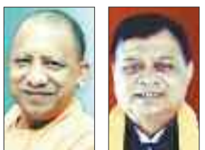
योगी आदित्यनाथ लखनलाल

हेलीकॉप्टर से कोरबा आएंगे। उत्तरप्रदेश के मुख्यमंत्री योगी आदित्यनाथ 21 अप्रैल को कोरबा आगमन हो रहा है। इस दौरान श्री आदित्यनाथ कोरबा पूर्व के सीएसईबी फुटबॉल मैदान में आम सभा को संबोधित करते हुए भाजपा